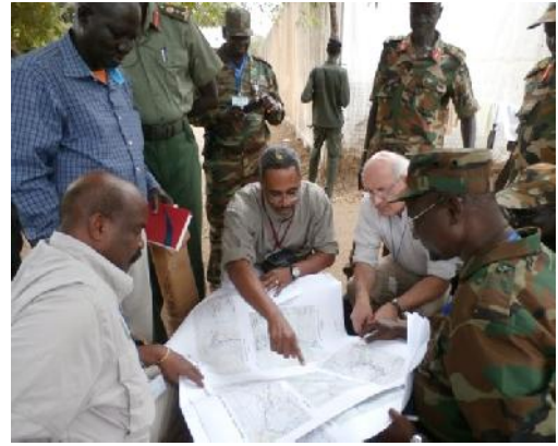
طنارذ علسملا مضر اعلمنا نوملسي داقيل أيملا يقارم أعز انتملا ة طانملا - كاقاف ة عامتخا - ر مسمد 2014

في إطار هذه الاتفاقات، تلزم آلية الإيقاد للرصد والتحقق بمواصلة واجباتها من أجل مساعدة شعب جنوب السودان ليعيش في بيئة آمنة، حتى يتم الاتفاق على وقف إطلاق نار دائم وتسوية سياسية وتنفيذها.