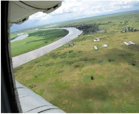
ق قحتو دصر قيرفد أيرودع لطنست طابوسنا رهنق وقف

في نوفمبر تشرين الثاني عام 2014 تم عقد ورشة عمل باديس أبابا لتنفيذ الإتفاقية شارك فيها الطرفين تحت رعاية الهيئة. هدف الورشة هو إعداد الخرائط والجدول الزمني المتفق عليها والعمل على ترتيبات محددة لفك الارتباط والفصل بين القوات وانسحابها. ساعدت الورشة في تحديد خطوط الحدود والأراضي المسيطر عليها من كل جانب، فضلا عن المناطق المتنازع عليها والتي كان لا بد من التحقق منها. واتفق الجانبان على إنشاء "مناطق الترتيبات الخاصة" حيث كانت القوات متقاربة من بعضها، وذلك من أجل نزع فتيل التوتر وتحقيق فصل فوري للقوات. تحديد وتوضيح هذه المناطق على الخرائط استمر في الميدان مع الطرفين.